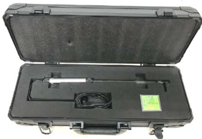
專用防塵防震鋁箱 費用：新台幣 2,500 元