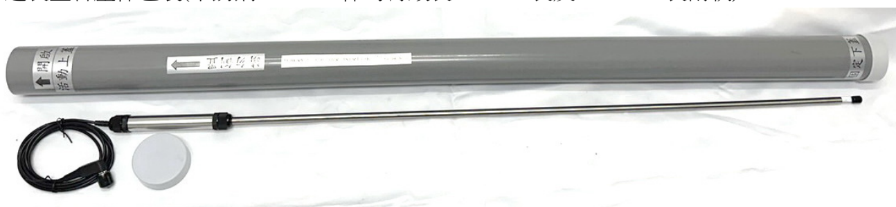
特製塑膠筒 費用：新台幣 0 元