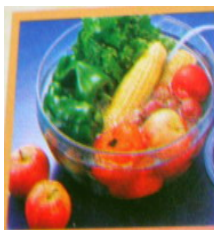
蔬菜去除農藥毒素

臭氧與陰離子配合，能將懸浮於空氣中之粉塵、細菌、病毒、黴菌孢子吸附固定，並予以分解殺菌。對於有毒氣體，臭氧均能將以完全分解或是中和，及降低毒性。