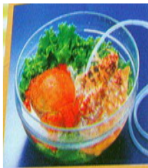
生鮮魚肉殺菌保鮮