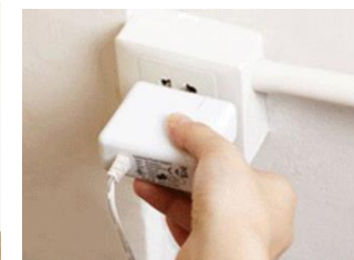
6 · 插上電源，選擇燈光與造霧大小