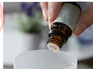
4 · 這時可選擇滴入喜歡的精油