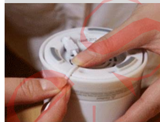
1 · 插上電源並扣好電源線