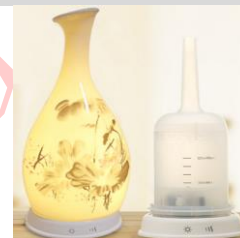
2 · 取下外罩