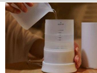
3 · 倒入乾淨冷開水至最高水位線