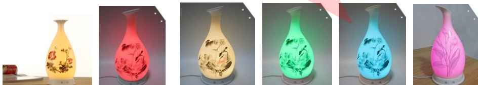
溫馨暖燈款 雅趣彩燈款/玫紅/琥珀黃/翠綠/湖藍/葡萄紫(燈光顏色可自行設定)